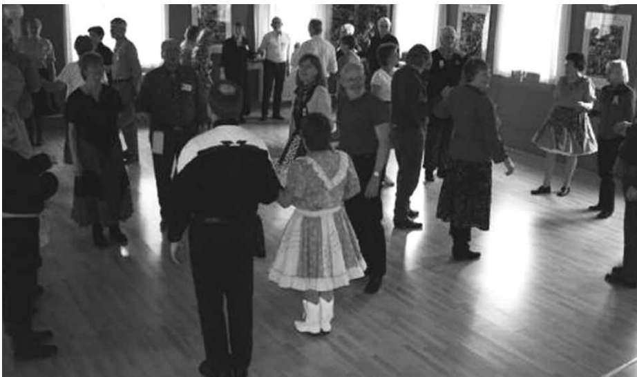
Linedance på Sct. Jørgens Skole